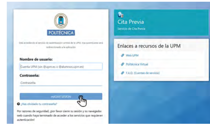
INTRODUCIR USUARIO Y CONTRASEÑA Usuario (cuenta UPM sin @upm.es o @alumnos.es)