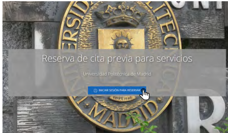
INICIAR SESIÓN PARA RESERVAR