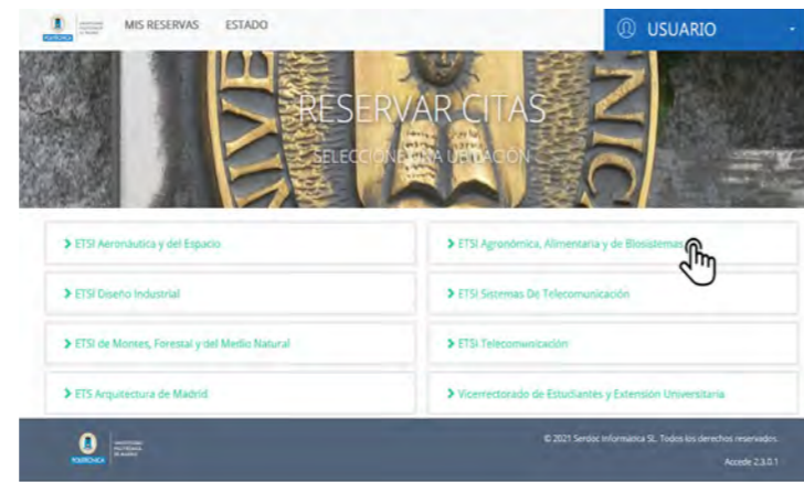
ETSI AGRONÓMICA, ALIMENTARIA Y DE BIOSISTEMAS